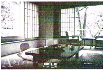
「花の宿・松や」のホームページより、視察団が「夢の温泉三昧」を堪能したと思われる和室。狭いビジネスホテルとは格段の差である。

そして坂戸議事事務局はこの事情をうすうす知っていたため「日光市から要望があった」と、本紙に対し嘘を回答した……。あくまで推測だが、そう受け取るしかないのは残念だ。ただでさえ日光市は観光地である。観光地の自治体を視察するのなら、市民に疑念を持たれるような行動についてはいっそうの注意を払うべきではないのか。ビジネスホテルがたまたま満室だったのなら、視察時期をずらせば済むことである。緑政会の日光市視察目的は同市の「地産地消推進計画」と「遊休農地・耕作放棄地対策について」だ。何をわざわざ春休み期間に視察する必要があったのか。小さなことかもしれない。だが議員定数削減や議員報酬カットを真剣に議論している地方議会にあって、「宿泊費の上限」以下とはいえ、公金で温泉宿に平気で泊まる緑政会市議らの神経を、本紙は強く疑う。「温泉に泊まったから市民はどう思うだろうか」と一瞬でも考えなかったのか。考えたならば「例外的に温泉旅館に宿泊せざるを得なかった理由」を、視察報告書に添付すべきだ。それが市民に対する誠意であり、市議会議員が持つべき資質の、基本中の基本である。